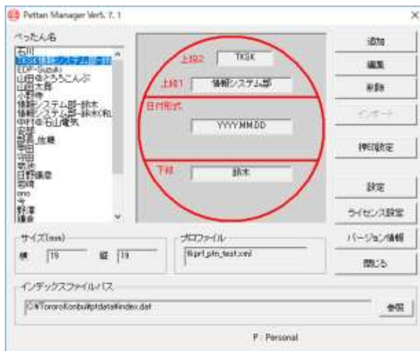
日付印べったんの管理ツール

管理者のみが管理ツールを利用できます。押印者は印影登録ができませんのでセキュリティが保たれます。